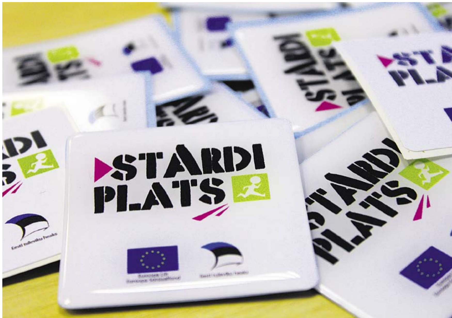
Noorteportaal asub aadressil www.stardiplats.ee .

Portaali kasutusala ei piirdu ainult praktiliste nõuannetega, vaid see on ka koht, kust noored saavad eneseoskusi