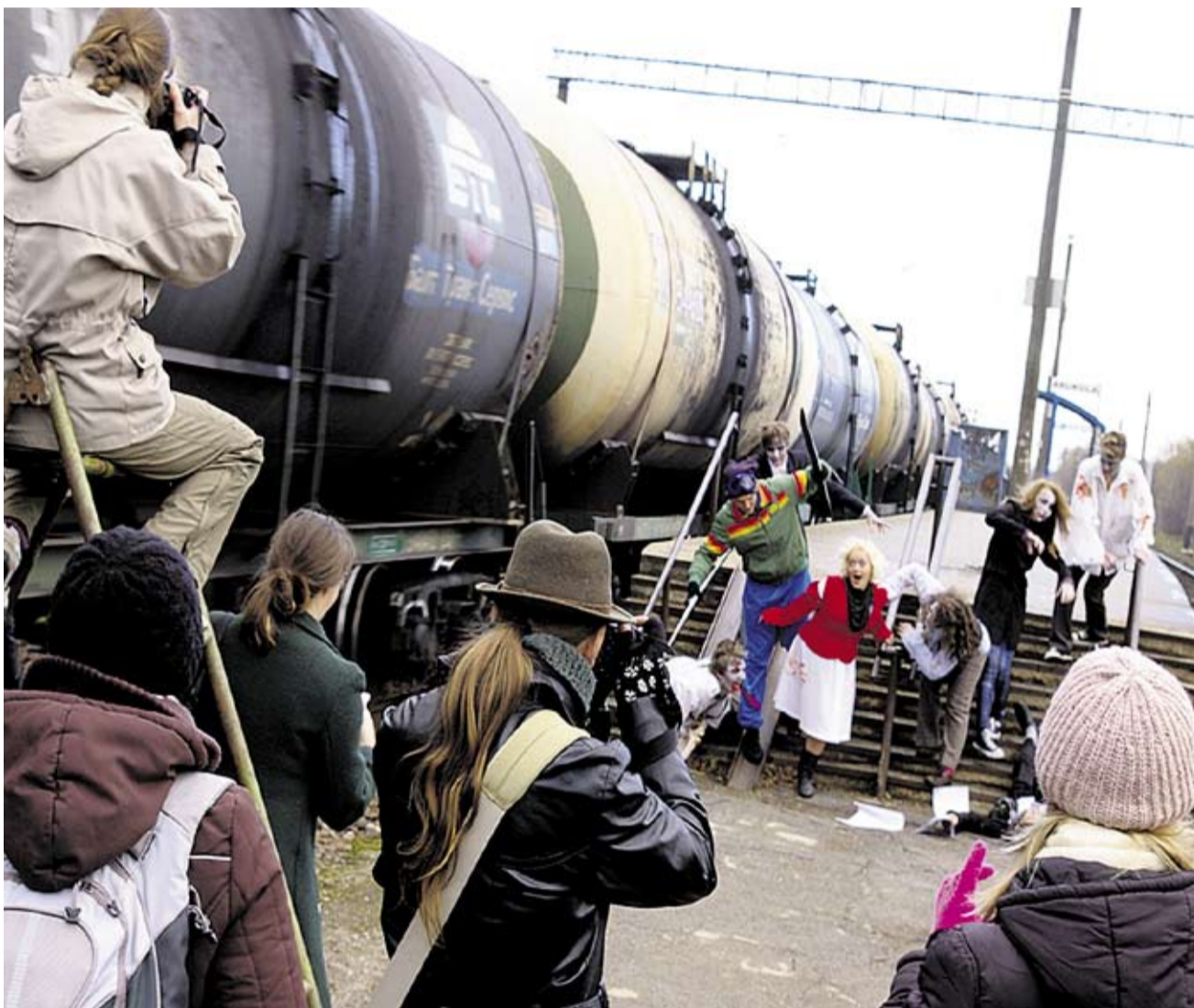
Aruküla noored projektis «RongART».

Mobiilse noorsootöö tegijaid ei tasu karta. Nad on teie sõbrad ja abilised, kes võimalusel püüavad suunata teie arengut. MONO on uus asi nii noortele kui ka tegijatele endile. Seega õppigem koos.