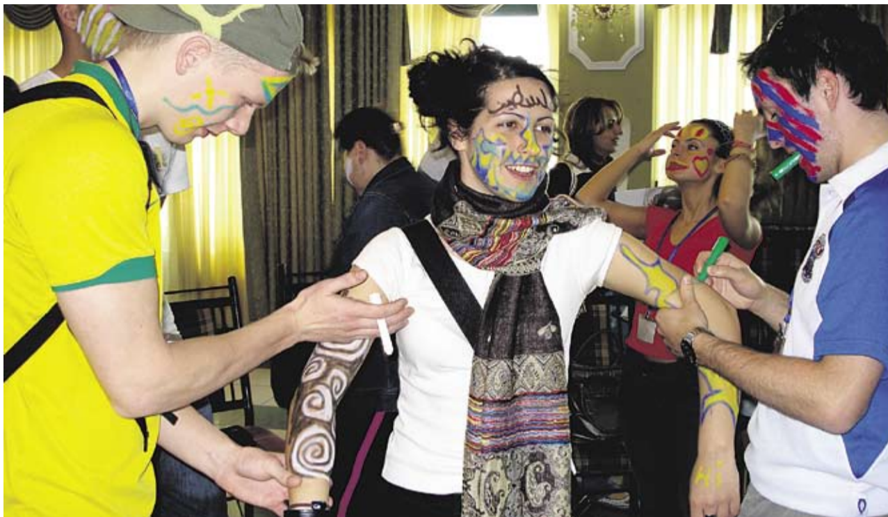
Noored osalemas kultuuridevahelise õppimise töötoas.

«IT öö» raames leiab aset simulatsioon tuleviku leiutajatele, kus noortekeskuste meeskonnad peavad ühe öö jooksul endale meelepärasteid tehnikaid kasutades leiutama infotehnoloogilise lahenduse meie igapäeva elukeskkonnas parandamiseks ning hiljem seda oma konkurentidele presenteerima. Noortekeskused on omavahel ühendu-