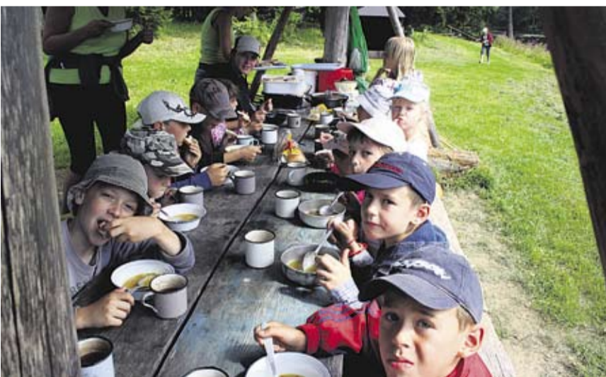
Lapsed Vihasoo noortelaagris lõunat söömas.

Noortelaager kui üks noorsootöö meetod on sotsiaalseid ja personaalseid oskusi arendav keskkond. See mõjutab