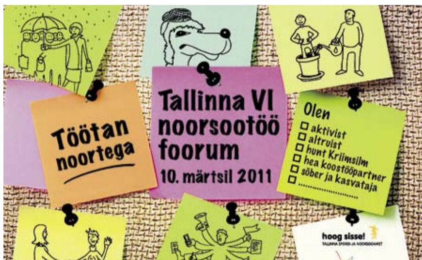
Tallinna VI noorsootöö foorumi plakati.

Üks lugu rääkis hiirest, kes metsas lehe all värikes ning kelle käest metsahaldjas küsis, miks ta väriseb. Hirmust teiste ees muidugi. Haldja võimuses oli hiir kassiks muuta, ent järgmisel jalutuskäigul metsas leidis haldjas eest põõsa all väriseva kassi. Nii muudeti kass veel suuremaks loomaks ja veel suuremaks, lõvini välja – loomade kuningaks –, ent ikka ja jälle värisen loom kusagil põõsas. Haldjas otsustas asja tuumani jõuda ja küsis: «Miks sa lõvina ikka veel väriseb – kõik kardavad sind ju?» Ent lõvi, vabandust, tegelikult hiire vastus oli: «Mina ise tean, et olen