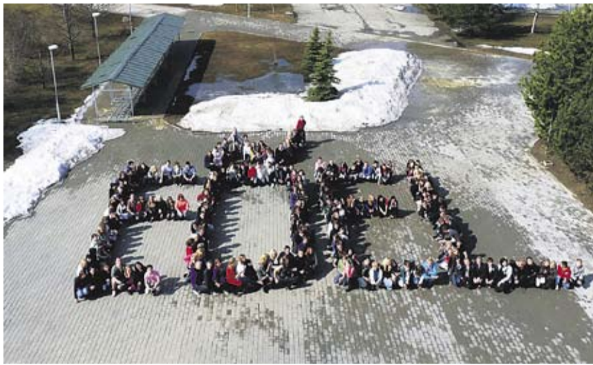
Õpilased 2010. aasta kevadel EÕELi üldkoosolekul enda esindusorganisatsiooni nime moodustamas.

UUS JA PAREM EKSAK ÕPILASTELE EÕEL on käinud välja oma nägemuse teadmiste ja õpitud oskuste kontrolliks, selleks on matemaatika-loodusteaduste küpsuseksam. Praegune ja paari aasta pärast rakenduv matemaatikaeksam annab vaid ainult osa kogu fundamentaalsest loogilisest mõtlemisest, kuid selle kõrvalt puudub analüüsi- ja seos-